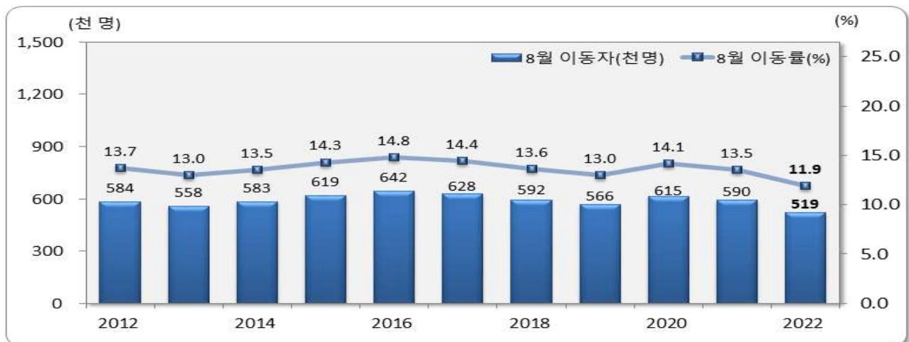
[그림 1] 전국 8월 인구이동